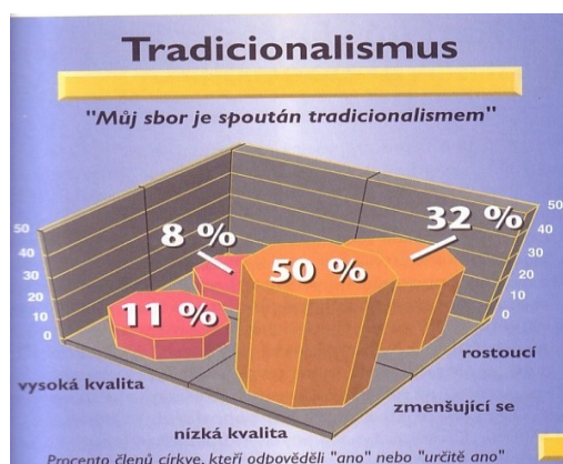
Graf 7 Tradicionalismus 2

"Kdekoli Bůh vdechne svého Ducha do beztvareho jílu, vytryskne život a organizace." 1